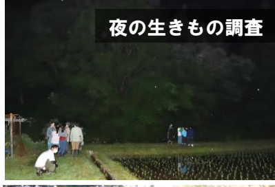
夜の生きもの調査