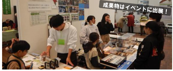
成果物はイベントに出展！